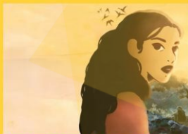
LES HIRONDELLES DE KABOUL