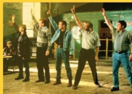
THE FULL MONTHLY

Modalités de vote et Bulletin de vote disponibles à l'Espace Saint-Germain et sur notre site internet en scannant le QR code ci-dessus.