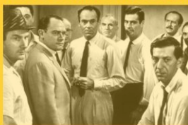
DOUZE HOMMES EN COLÈRE